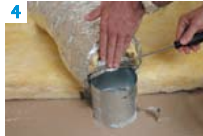
4 Raccordement des gaines de soufflage.