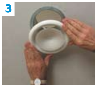
3 Des bouches de soufflage disposées au plafond de chaque pièce.