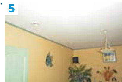
5 Discretion assurée