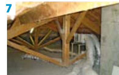
7 Dans les combles : votre installation fonctionne