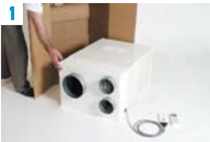
1 L'unité centrale de climatisation est prête à fonctionner.