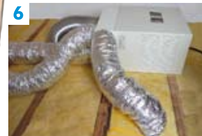
6 Aucun élément visible. Toute l'installation est dans les combles, sous la toiture.