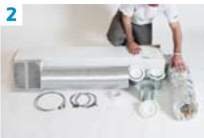
2 Tout est prévu pour un montage simple.