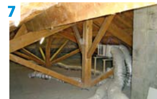
7 Dans les combles : voilà votre installation fonctionnant