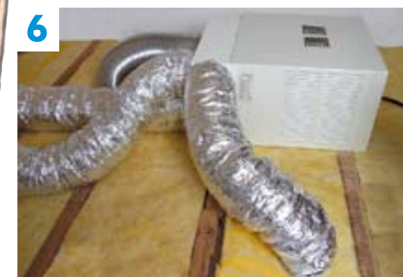
6 Aucun élément visible. Toute l'installation est dans les combles, sous la toiture.