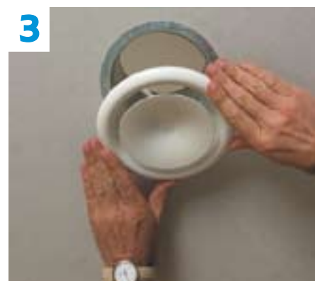
3 Des bouches de soufflage disposées au plafond de chaque pièce.