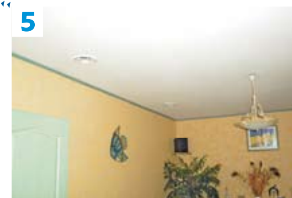
5 Discrétion assurée