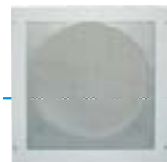
Grille d'aspiration de recyclage