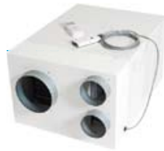
Groupe monobloc (réversible et pompe à chaleur)