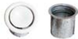
Bouches de soufflage réglables