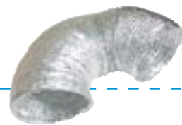
Gaine d'aspiration de recyclage