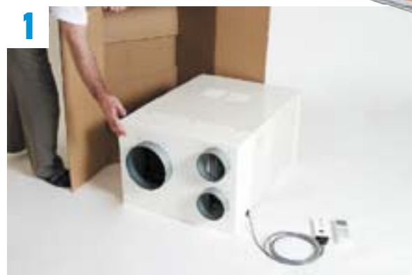
1 L'unité centrale de climatisation est prête à fonctionner.