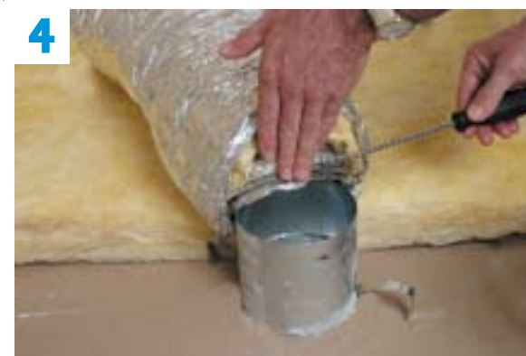
4 Raccordement des gaines de soufflage.