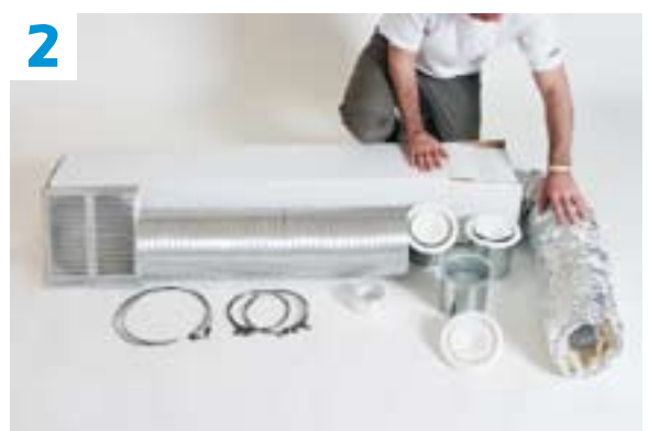
2 Tout est prévu pour un montage simple.