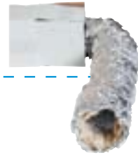
Gaine de soufflage souple isolée