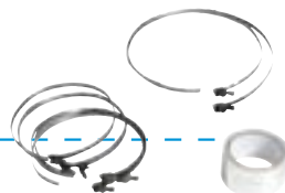
Accessoires de raccordement